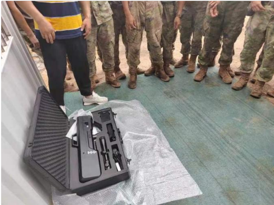
Packaging and Delivery